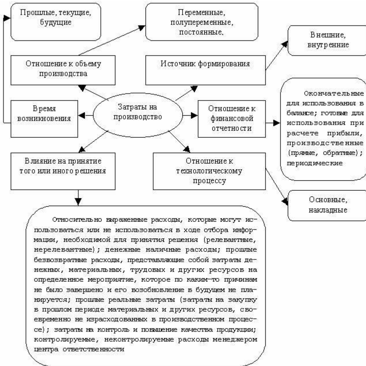
Рисунок 2. Зарубежная классификация затрат на производство

Данная классификация полностью охватывает все виды категорий затрат, применяемые в англосаксонской и американской системах учета. В качестве недостатка предложенной классификации можно выделить тот факт, что классификационные признаки и виды затрат соответственно не являются строго определенными для предприятий. Каждое предприятие в данном вопросе имеет полную самостоятельность и использует такую систему классификации затрат, которая является наиболее удобной.